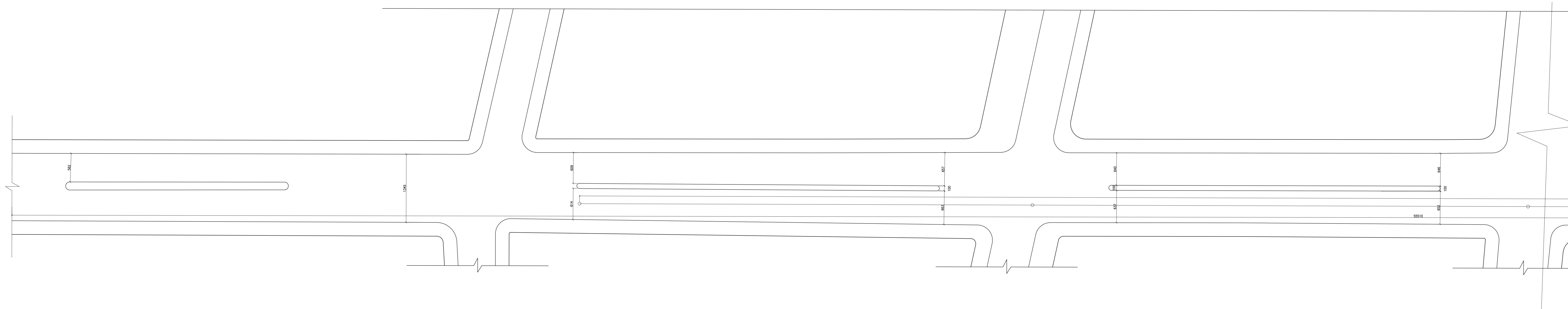
DRENAGEM PARTE 1 Escala 1/300